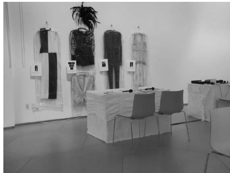
Vogue'ology , Parsons The New School for Design, New York, 2010.

naître. Il possède aussi un caractère public (et un destinataire) : il formule publiquement une intention. Le travail de l'organisateur d'expositions pourrait alors être comparé à de la « gestulation ». Il ou elle lance des signaux familiers, propose des formes et des signes rhétoriques, qui peuvent être complétés par des éléments tout autres, et complexes, dans le sens du zéro maya. Les gestes et leurs effets ne se laissent pas plus mesurer que ce zéro, et le succès de l'exposition devra se réclamer de l'évidence anecdotique qui rend compte de la création d'un espace, d'une pause.